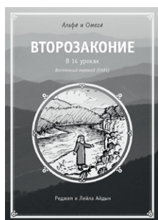
Второзаконие в 14 уроках ( Восточный перевод (CARS) )