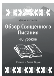
Обзор Священного Писания: 40 Уроков